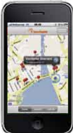
Wie komme ich hin? Google zeigt den Weg zum Tisch.

W as essen wir heute Mittag? Diese Frage lässt sich nun auch von unterwegs beantworten.