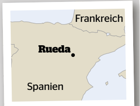
Rueda Hauptort gleichnamiger Weinregion Spaniens.