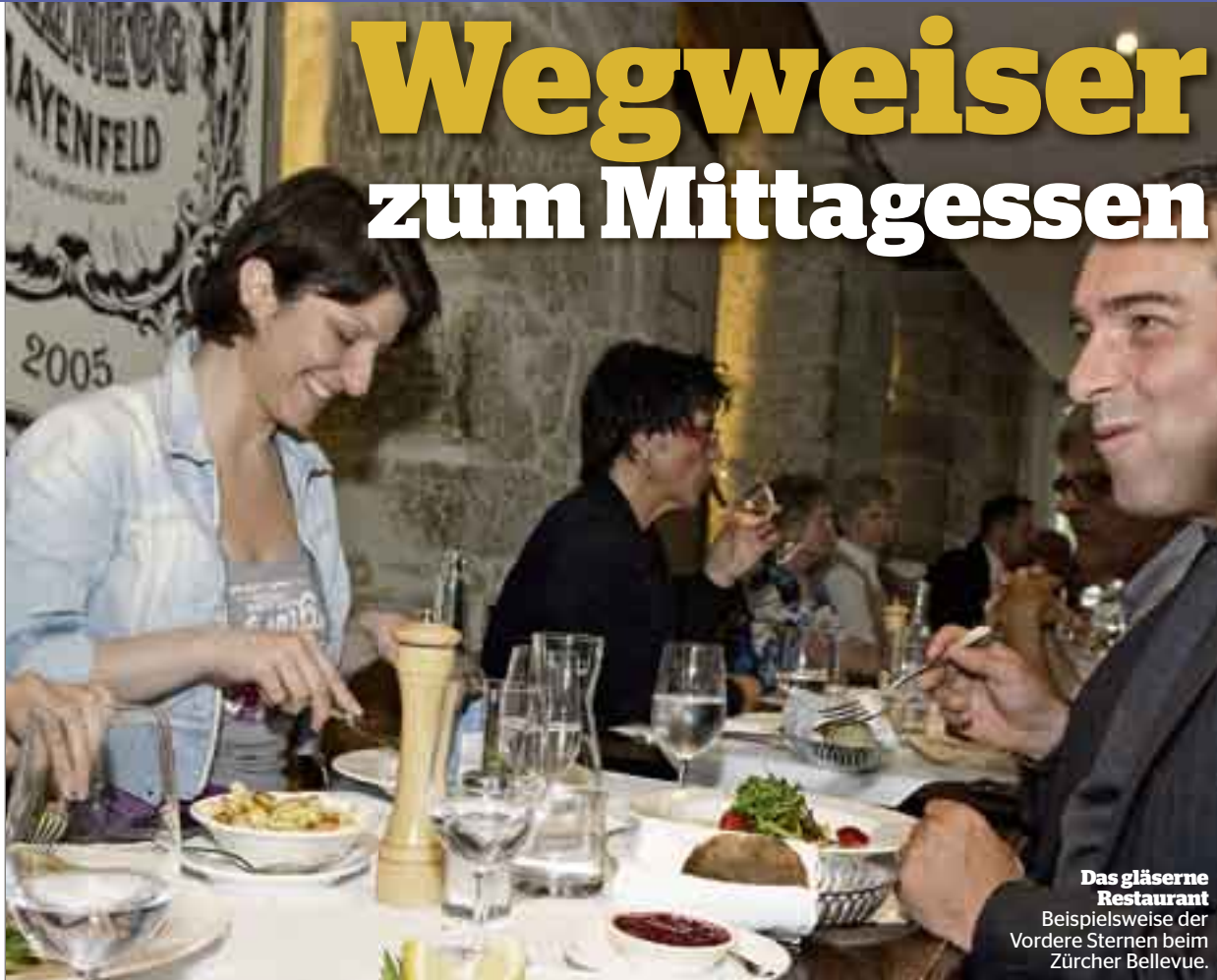
Das gläserne Restaurant Beispielsweise der Vordere Stern beim Zürcher Bellevue.