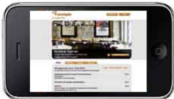
Wie sitzt man? So sieht es drinnen aus.

GASTRO → Wo gibts ein gutes Schnitzel? Wo hats noch Platz? Jetzt gibt es endlich Antworten.